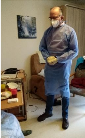
Seelsorgerliche Begleitung schwer Erkrankter.

Den Bewohnern, die noch nicht davon genesen sind, wünschen wir eine baldige und gute Besserung, den Angehörigen der Verstorbenen gilt unsere Anteilnahme und dem Personal unsere Hochachtung und Dank!